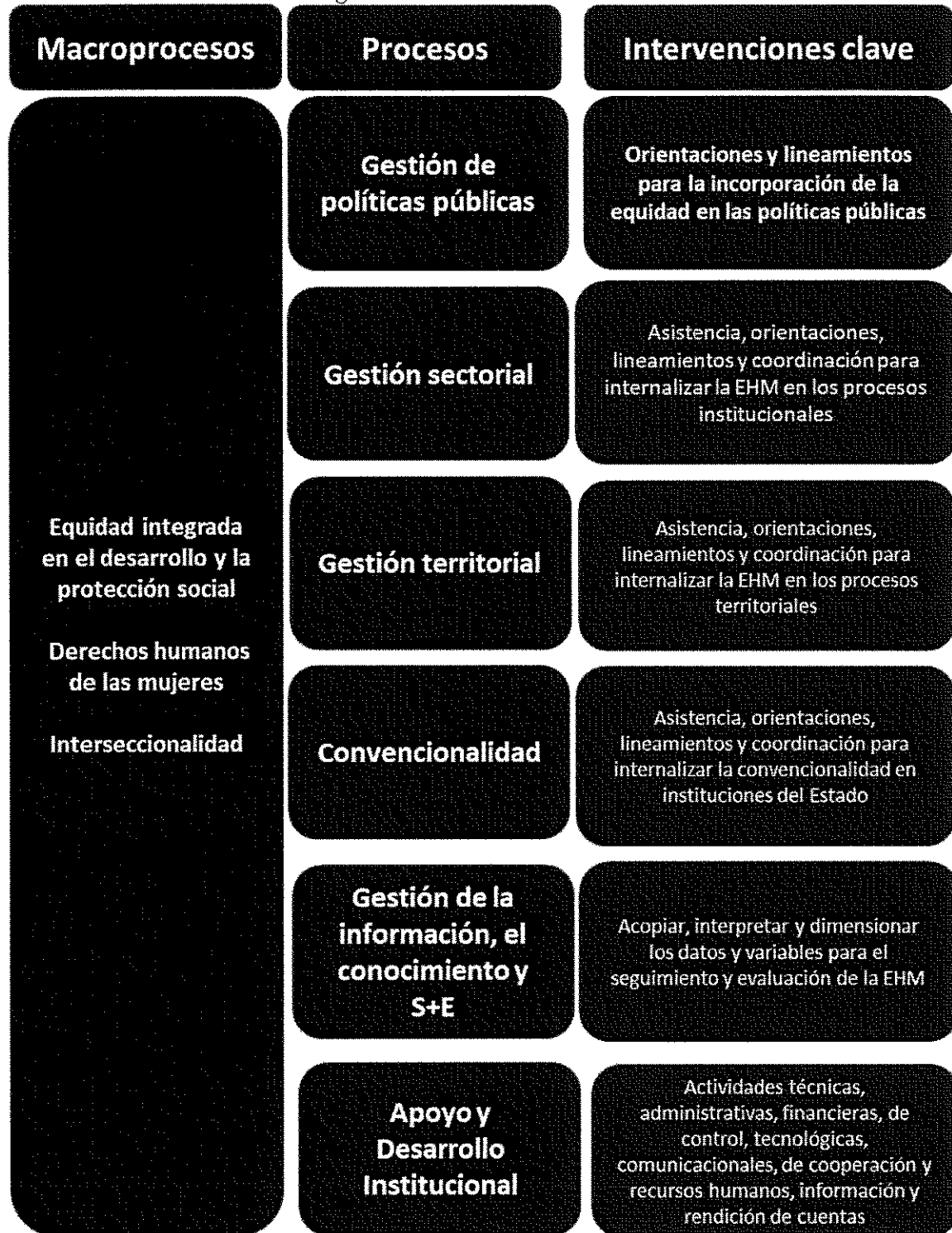
Diagrama 1. Gestión institucional