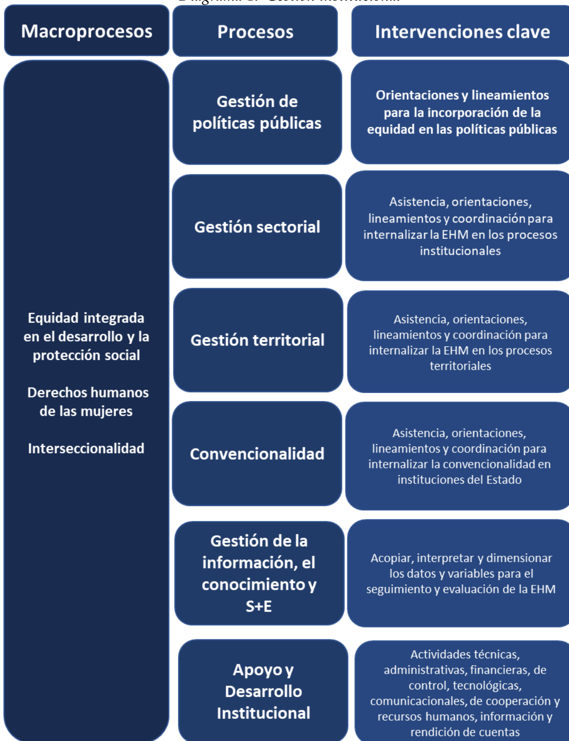
Diagrama 1. Gestión institucional