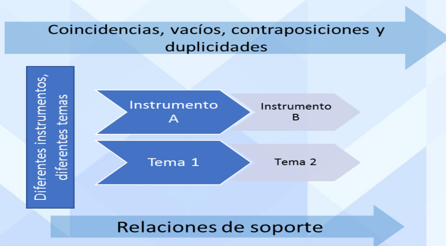
Figura 5. Relación indirecta entre instrumentos