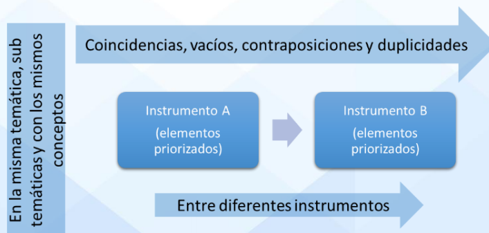
Figura 3. Relación directa entre instrumentos