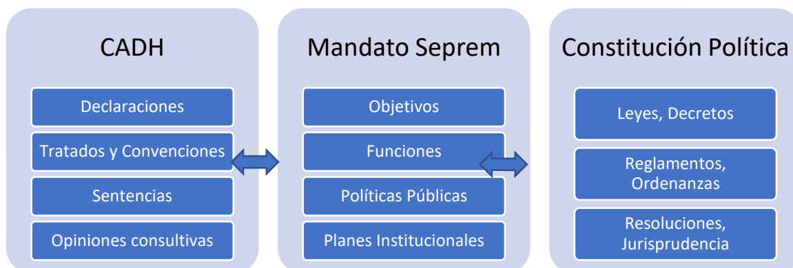
Figura 1. Interrelación entre mandato institucional de la Seprem y normativas internacionales y nacionales